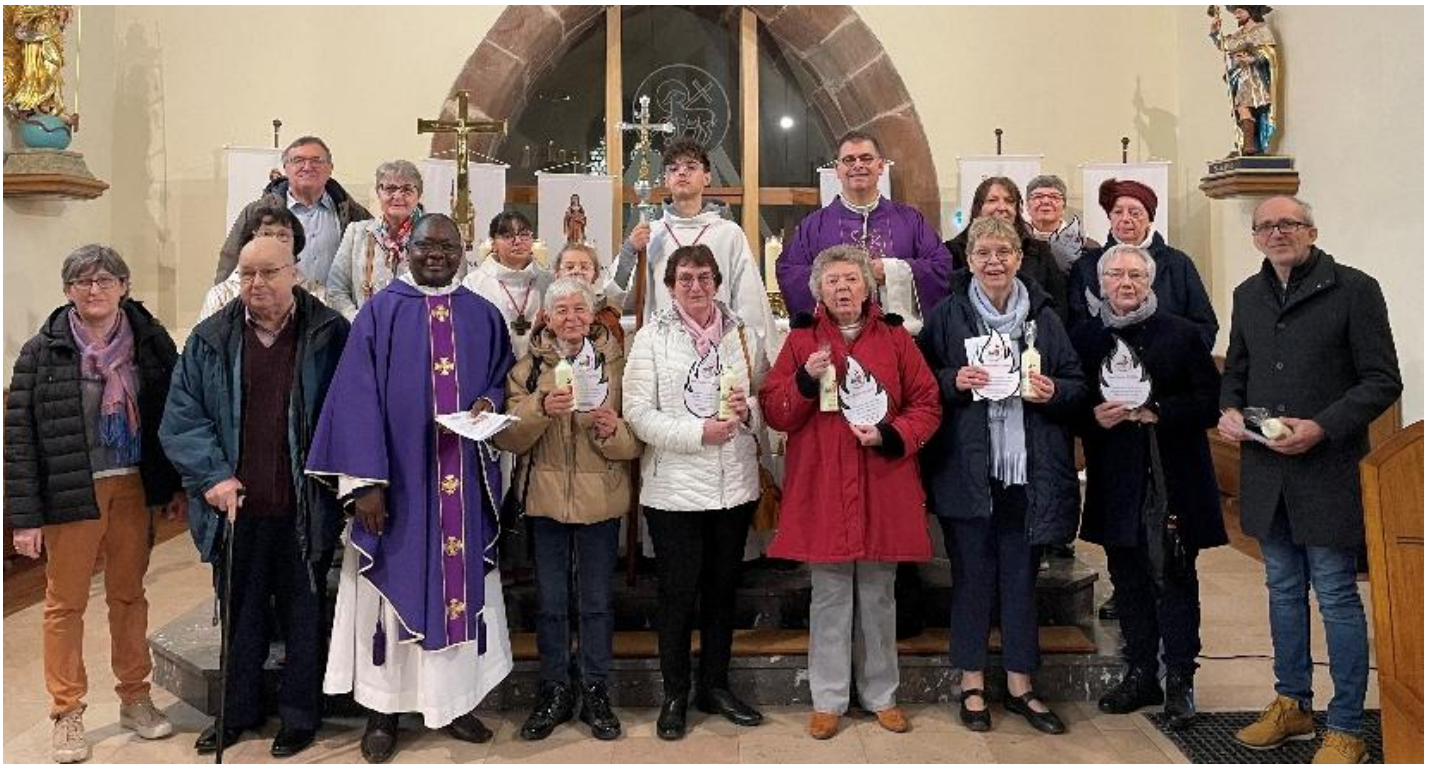
Quelques exemples de symboles remis aux jubilaires.