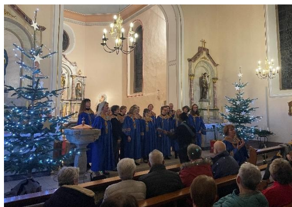
Rencontre Œcuménique à l'Eglise de Melsheim le Samedi 13 Décembre 2025