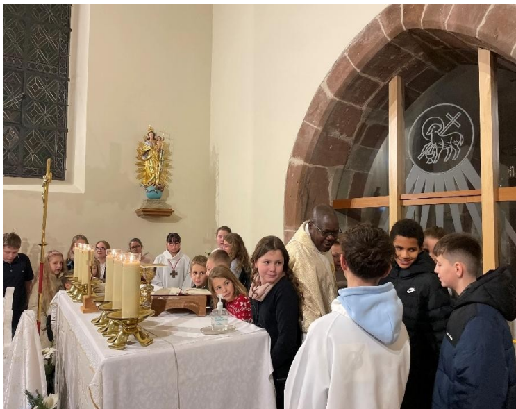
Messe de Noël pour les Familles Dettwiller 24 décembre 2025