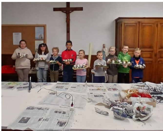
Fabrication et bénédiction des couronnes de l'Avent des enfants