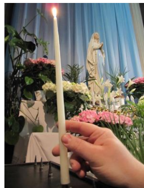
Dettwiller, mai 2014