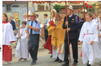
Fête Dieu 2019, à Altenheim

Tantum ergo sacramentum, / veneremur cernui, et antiquum documentum novo cedat ritui : / praestet fides supplementum sensuum defectui.